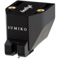
Ersatznadel Amethyst UVP 595,00 €