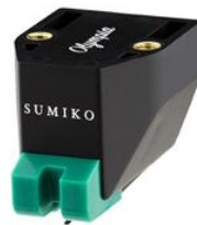
Ersatznadel Olympia UVP 155,00 €