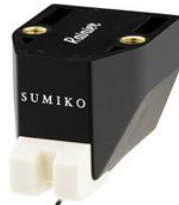
Ersatznadel Rainier UVP 95,00 €