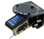
Blue Point Special Evo III Hi