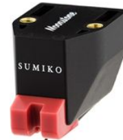
Ersatznadel Moonstone UVP 270,00 €