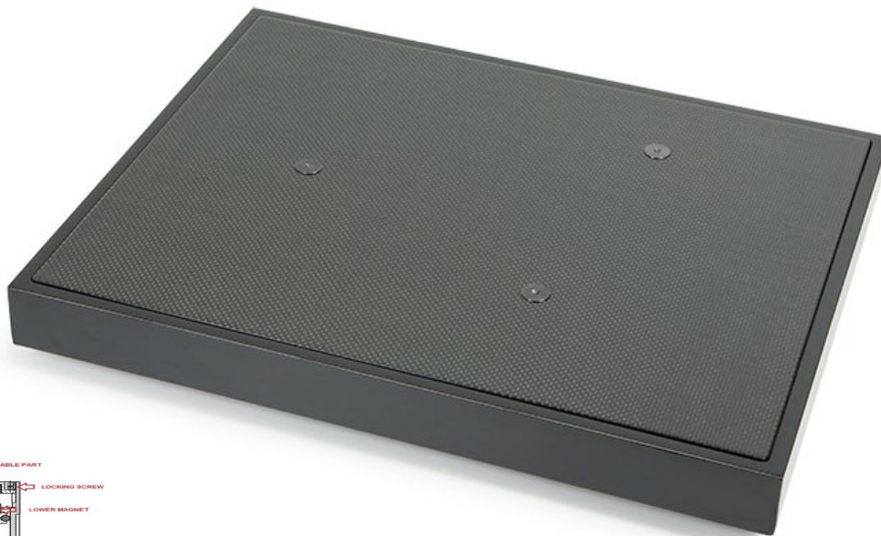
Ground it Carbon MagnetfeldfüÙe