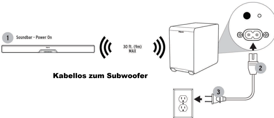
Kabellos zum Subwoofer