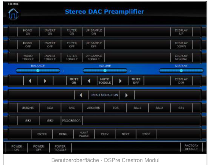
Benutzeroberfläche - DSPre Crestron Modul